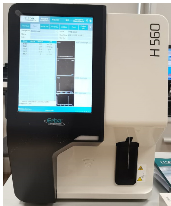
б) Модель H 560