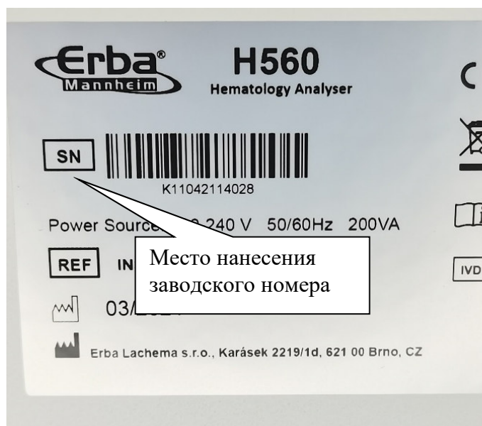
б) Модель H 560