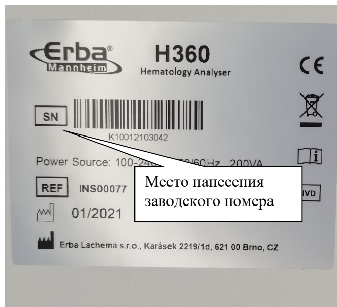
а) Модель H 360