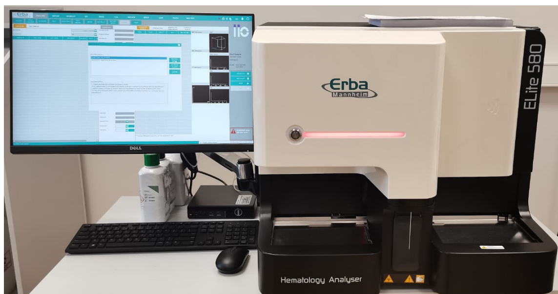
в) Модель Elite 580