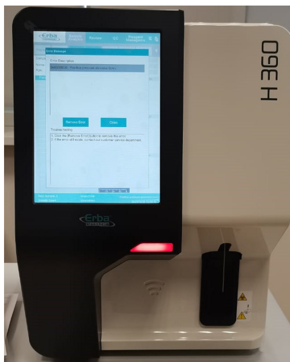
а) Модель H 360