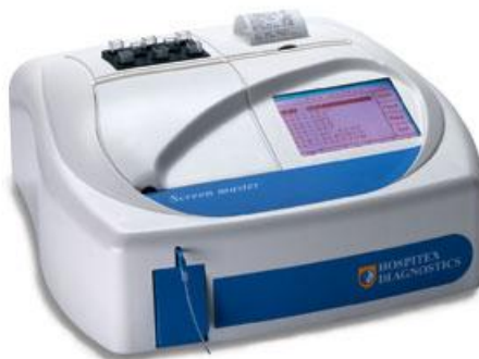
Рисунок 1 – Общий вид Анализаторов исполнения 01

Общий вид анализаторов представлен на рис. 1-3.