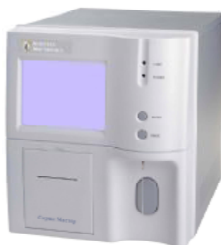
Рисунок 3 – Общий вид Анализаторов исполнения 03