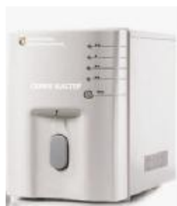
Рисунок 2 – Общий вид Анализаторов исполнения 02