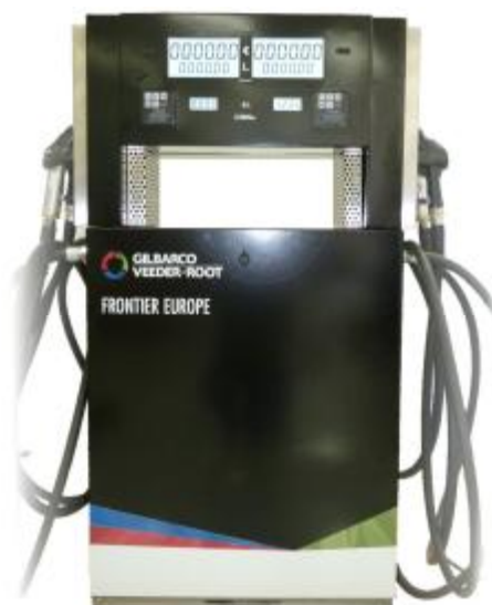
Р и с у н о к 1 – Колонка топливораздаточная SK700-2/Frontier Eu.

Блок электроники комплектуется электронагревателем для устойчивой работы при отрицательных температурах окружающей среды.