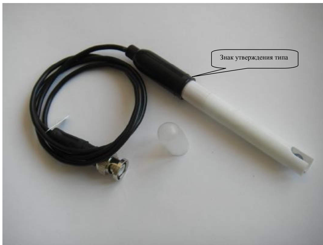
Рисунок 1 – Электрод комбинированный «ЭК-01»

Внешний вид электродов и схема обозначения мест для размещения знака утверждения типа представлены на рисунках 1-3.