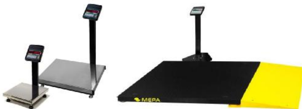
Рисунок 2 - Общий вид весов в исполнении П