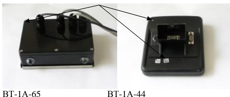
Рисунок 6 - Места пломбировки от несанкционированного доступа весов в исполнении П с индикаторами BT-1A-65 и BT-1A-44