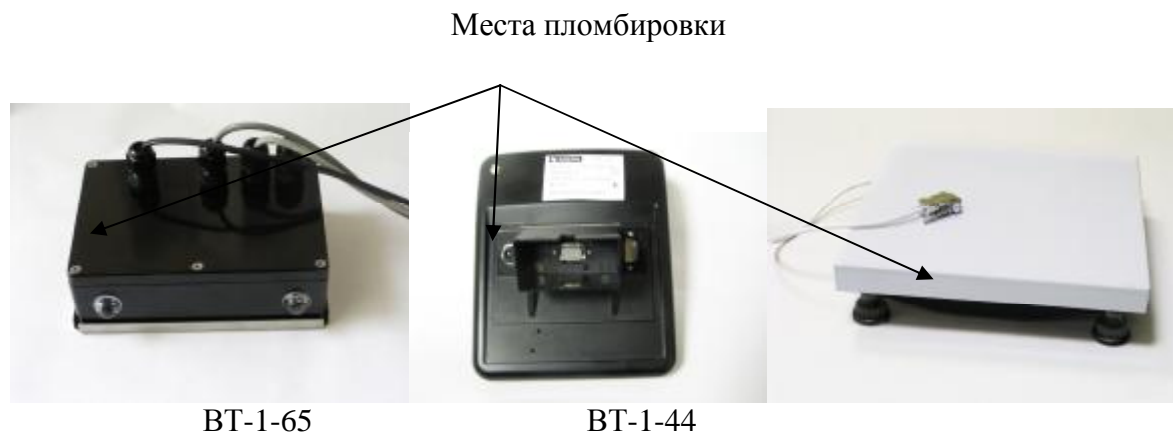
Рисунок 5 - Места пломбировки от несанкционированного доступа весов в исполнении П с индикаторами ВТ-1-65 и ВТ-1-44