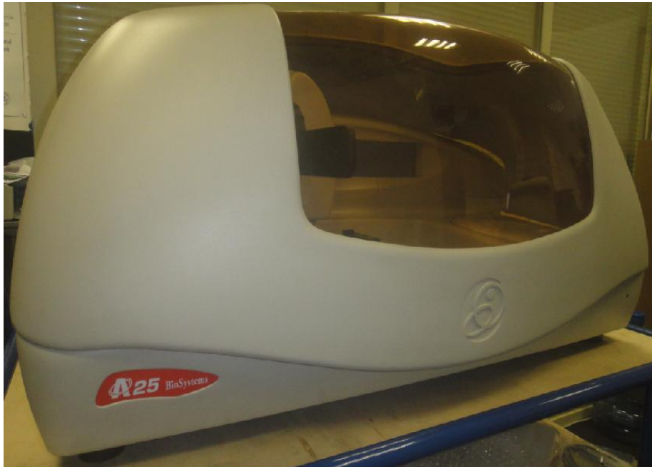
Рисунок 2 – Общий вид анализатора Random Access A-25