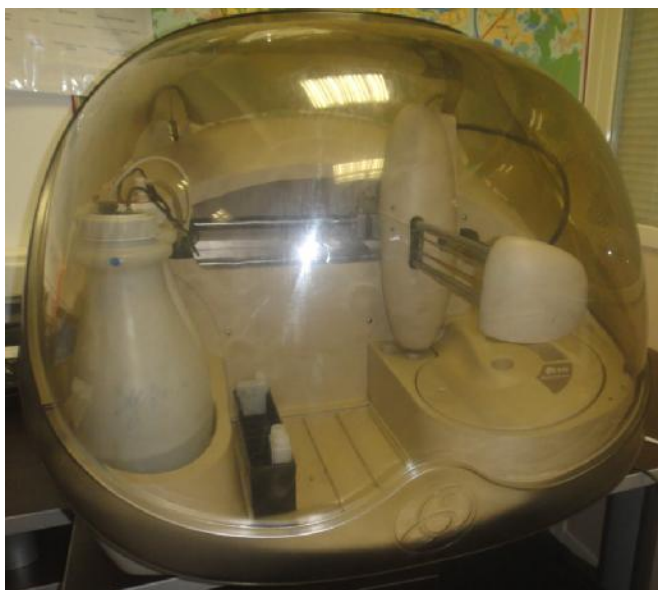
Рисунок 1 – Общий вид анализатора Random Access A-15

Управление и обработка результатов измерений проводится с помощью ПК