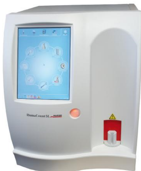
Рисунок 1. Внешний вид анализатора гематологического HumaCount 5L

Анализаторы позволяют определять нормальные параметры клеток крови пациентов и сигнализировать о патологических результатах, которые требуют дополнительных исследований. На основании полученных результатов вычисляются 22 параметра образца крови, а также выполняется построение гистограмм и скаттерграмм для использования в диагностике in vitro .