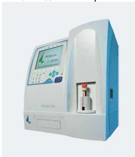
Рисунок 7 – Общий вид анализатора Abacus Junior EO