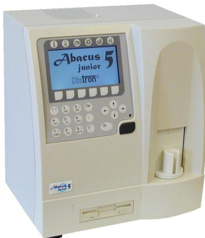
Рисунок 4 – Общий вид анализатора Abacus Junior 5