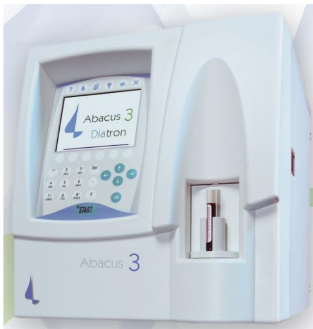
Рисунок 1 – Общий вид анализатора Abacus 3