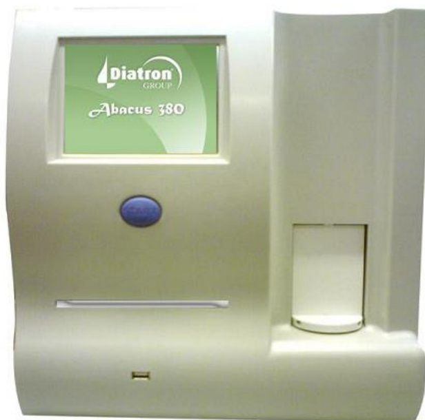
Рисунок 2 – Общий вид анализатора Abacus 380