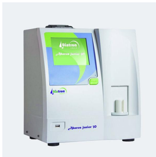
Рисунок 5 – Общий вид анализатора Abacus Junior 30