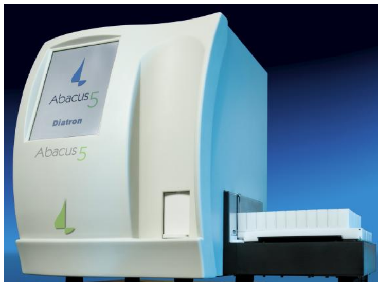
Рисунок 3 – Общий вид анализатора Abacus 5