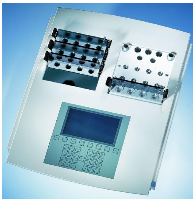
Рисунок 1 – Анализатор-коагулометр КС-4.

В коагулометрах используется электромеханический способ детекции сгустка. В процессе свертывания образуются фибриновые нити, которые приводят к изменению амплитуды колебания шарика относительно его инерционной позиции. Смещение шарика генерирует возникновение импульса в датчике и таймер останавливается.