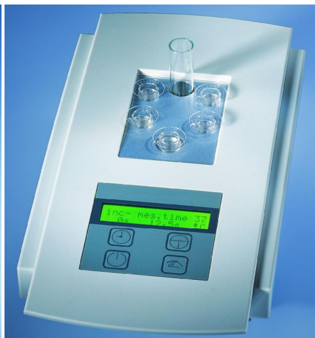
Рисунок 2 – Анализатор-коагулометр КС-1.