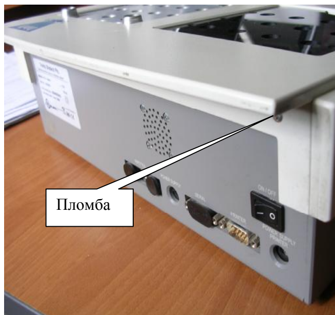
Рисунок 3 – Анализатор-коагулометр КС-4. Расположение пломбы.